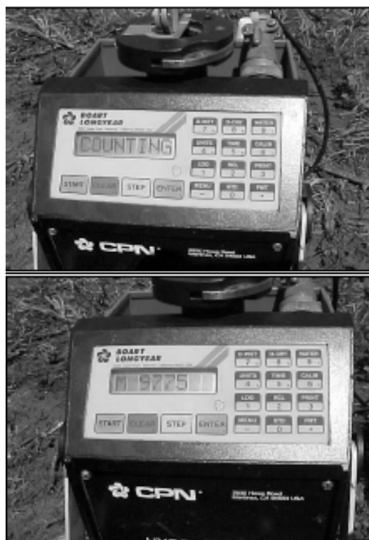
Fig. 3. Sonda de neutrones realizando el computo relativo.