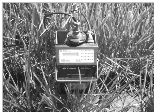
Fig. 1. Sonda de neutrones utilizada en el proyecto de investigación.

Como se puede observar en la Tabla 1, tanto el análisis de varianza de la regresión como el test de significación de la correlación son altamente significativos, indicando una buena regresión, lo que también se confirma por los altos coeficientes de correlación. En la Tabla 2 se presentan las varianzas de la humedad debido al error instrumental, la varianza de la humedad debido al error de calibrado, la varianza total de la humedad y la varianza debido a los errores locales, y sus respectivas desviaciones standard y los coeficientes de variación, para la determinación de la humedad del suelo con la sonda de neutrones.